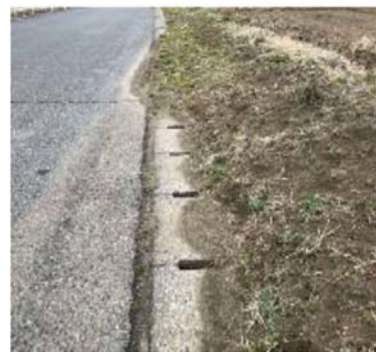
道路に流出した土砂

大雨の後に畑などの土砂が道路上へ流出し、歩行者や車の通行の障害となることがあります。また、流出した土砂が側溝を埋めてしまい、道路の排水機能が失われてしまう事例も見受けられます。皆様の道路の安全を確保するため、土地の所有者の方は土砂が流出しないよう防止策をお願いします。万が一、土砂が道路へ流出してしまった場合は、速やかに土砂の撤去をお願いいたします。