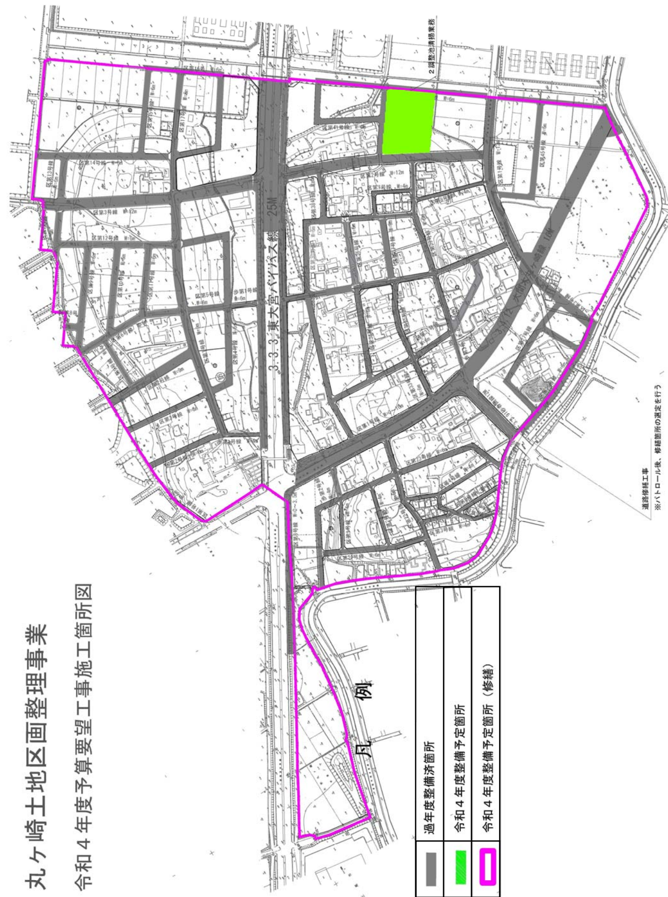
丸ヶ崎土地区画整理事業 令和4年度予算要望工事施工箇所図